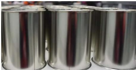
空缶の蓋を締める巻き締め作業に興味津々