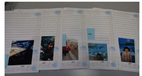
参加者は館内の好きな場所で自撮りした写真を取りこんだ便箋にメッセージを記入