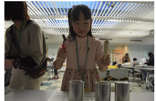
製品検査の方法を体験中