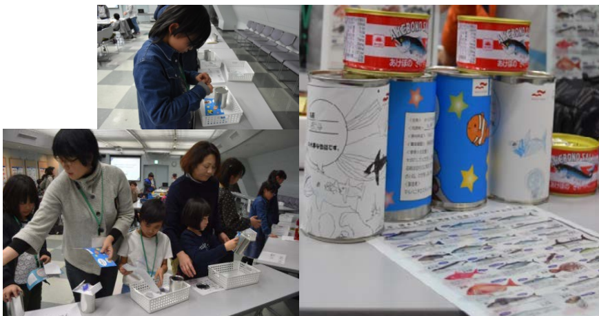
ラベルを缶詰に貼り付けたら、 世界に一つだけの「ハタチ缶」完成です