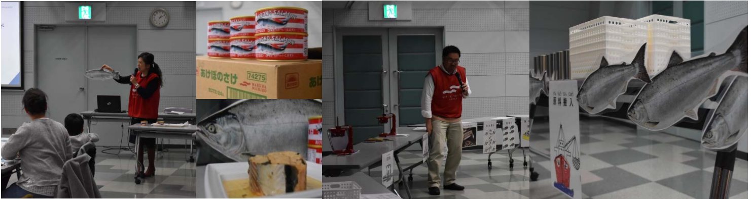
あけぼのさけ缶を例に缶詰の製造工程を解説 製造ラインに沿ってハタチ缶の作成を行いました