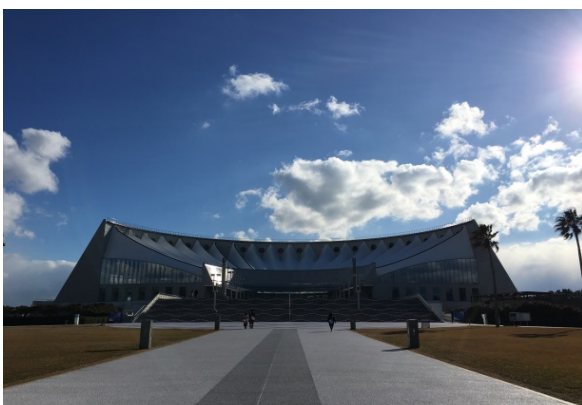
マリンワールド海の中道 （福岡市東区）