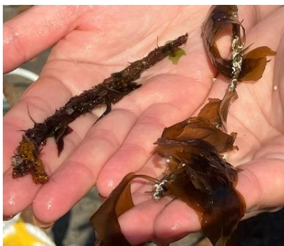
岩手県釜石産(左)と神奈川県横須賀産(右)の種糸