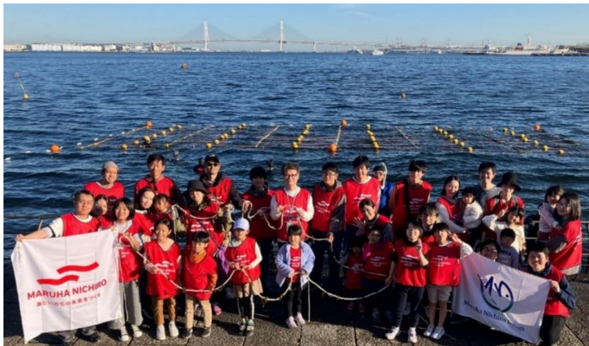
ワカメの種糸を付けたロープを持つ参加者の集合写真