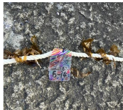
名札とワカメの種糸をロープに取り付ける参加者