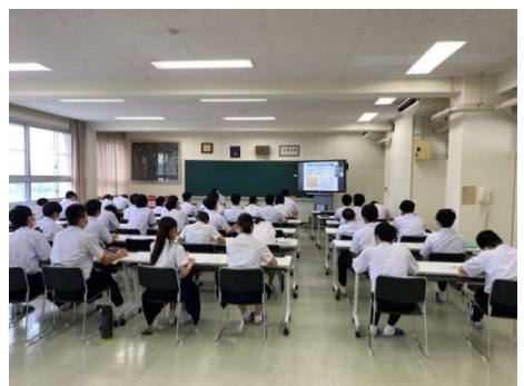
オンライン授業の様子

当日は経営企画部サステナビリティ推進グループの2名で対応し、SDGs「目標14：海の豊かさを守ろう」に関連したマルハニチロの取り組みについて説明を行いました。また今後の進路を考える高校生へ、社員の高校時の進路選択から現在についてお話ししました。オンラインでの実施でしたが、質問が多く活発に意見交換が行われ、良い交流の場になりました。