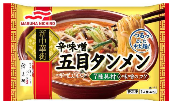
辛味噌 五目タンメン