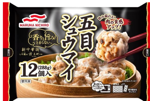
五目シュウマイ 香りと旨み