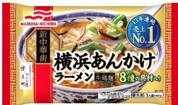
横浜あんかけラーメン®

(3) 賞品 マルハニチロ冷凍食品「新中華街®」シリーズ4品詰め合わせ (抽選で50名様)