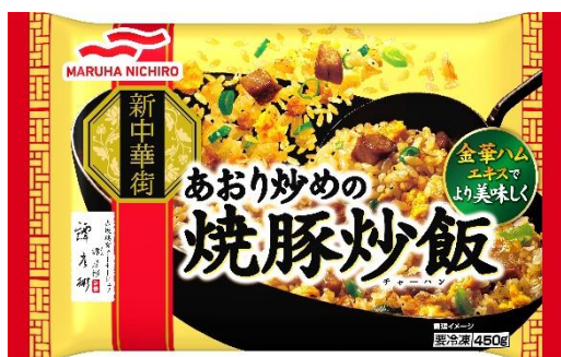
あおり炒めの焼豚炒飯