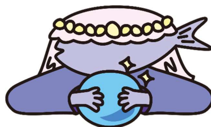
▲オリジナルキャラクター 「誕生魚診断」専属占い師 “占い鯷ブリトニー”