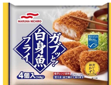
ガブッと! 白身魚フライ