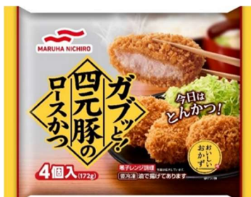
ガブッと! 四元豚のロースかつ