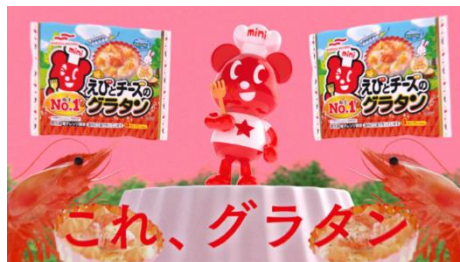
▲冷凍食品「えびとチーズのグラタン」編