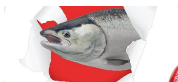
▲画面を飛び出すカラフトマス