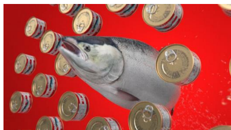
▲缶詰「あけぼのさけ」編