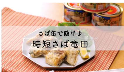
時短さば竜田（さば缶詰）

缶詰や冷凍食品などを使ったアレンジレシピ動画は今後も順次追加、公開していく予定です。