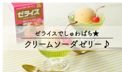
クリームソーダゼリー（ゼライス）