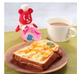
えびグラタンのリッチトースト （冷凍食品：えびとチーズのグラタン）

* アレンジレシピ動画は、YouTube「Maruha Nichiro Channel」の再生リストからもご視聴いただけます。