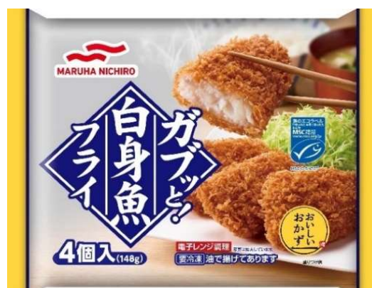
ガブッと！白身魚フライ

在宅率の増加に伴い、ご家庭で食事する機会が増えたことによる、簡便調理ニーズの高まりにおこたえするため、電子レンジで簡単に調理できる食卓向け惣菜を2品発売いたします。