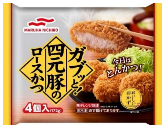
ガブッと！四元豚のロースかつ

マルハニチロ株式会社（本社所在地：東京都江東区、代表取締役社長：池見 賢）は、冷凍食品「おいしいおかず」シリーズより「ガブッと！四元豚のロースかつ」「ガブッと！白身魚フライ」を2021年3月1日（月）から全国で新発売いたします。