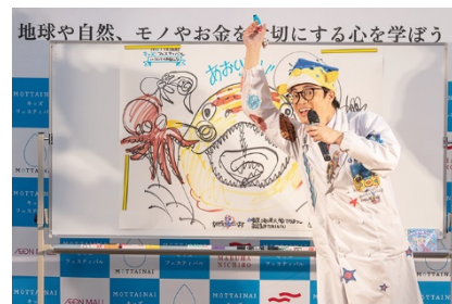
さかなクンのおさかな講座(イメージ)