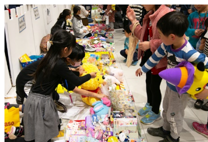
キッズフリマ(イメージ)