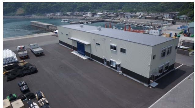
アクアファーム本社事務所