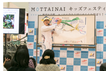
さかなクンのおさかな講座(イメージ)