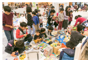
キッズフリマ(イメージ)