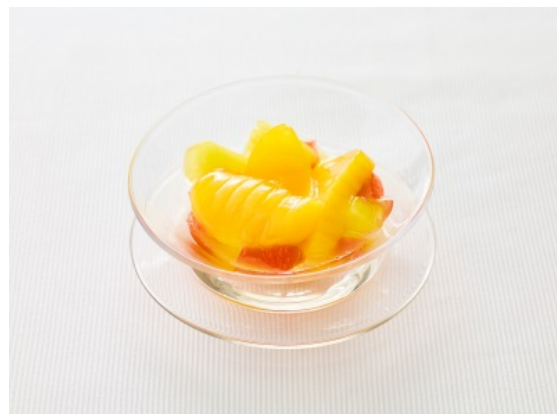
調理例：フルーツマリネ