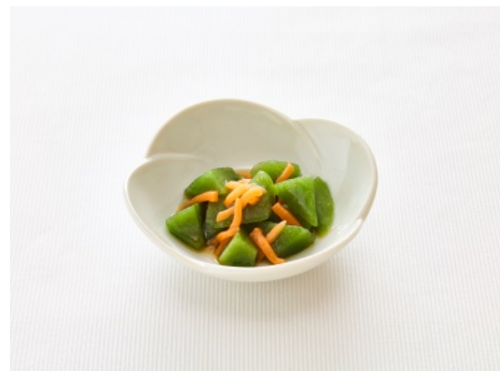
調理例：きゅうりのナムル