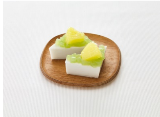
調理例：パインとココナッツのデザート