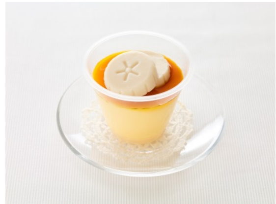
調理例：キャラメルバナナプリン