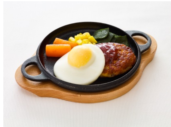
調理例：目玉焼きハンバーグ