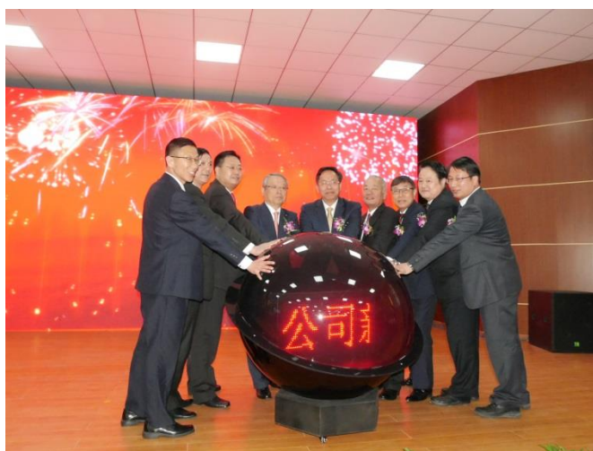
電光ボール点灯式の様子