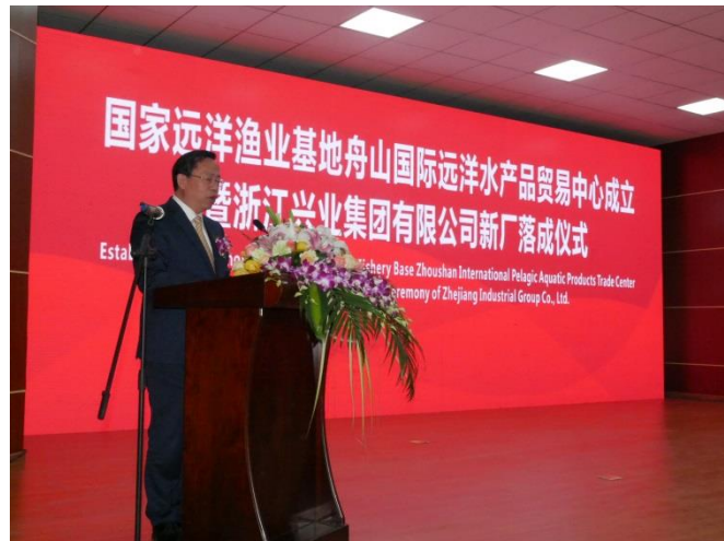
浙江興業集团有限公司 馬董事長のスピーチ