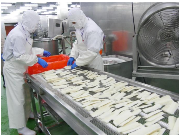
主力商品、いか加工品の製造ライン