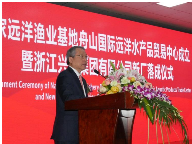
マルハニチロ(株) 伊藤社長のスピーチ

〒135-8608 東京都江東区豊洲 3-2-20 T: 03-6833-0826 F: 03-6833-0506