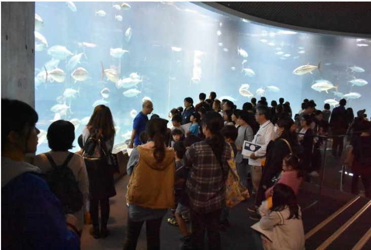
クロマグロの水槽前で、水族園スタッフの方から解説を聞き、クロマグロをスケッチ。

葛西臨海水族園の開園記念日にあたる10月10日は、「マグロの日」であるとともに「缶詰の日」でもあることから、記念日イベントにマルハニチログループとして参加いたしました。クロマグロの水槽を前に生態観察をして絵を描き、巨大なクロマグロのオブジェの前で写真を撮り、缶詰に詰めました。また、養殖の現状や水族園にクロマグロが届くまでの講話をおこないました。