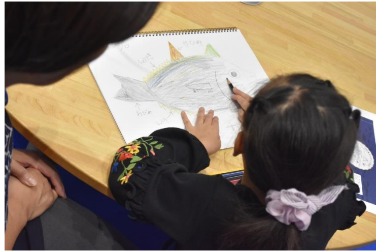
スケッチの仕上げ。部位の名称の「しょうりき」「第一背びれ」等詳しくなりました。