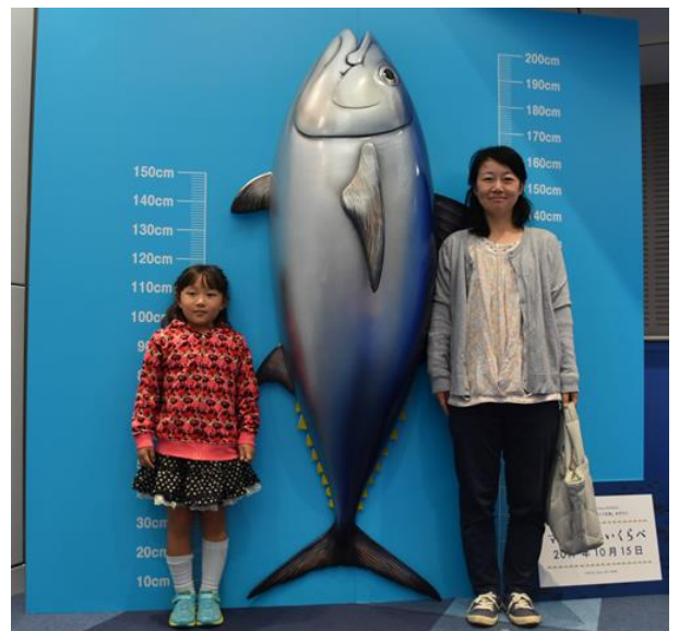
オブジェ「マグロとせいくらべ」 今日の記念に、缶詰にこの写真も一緒にいれました。