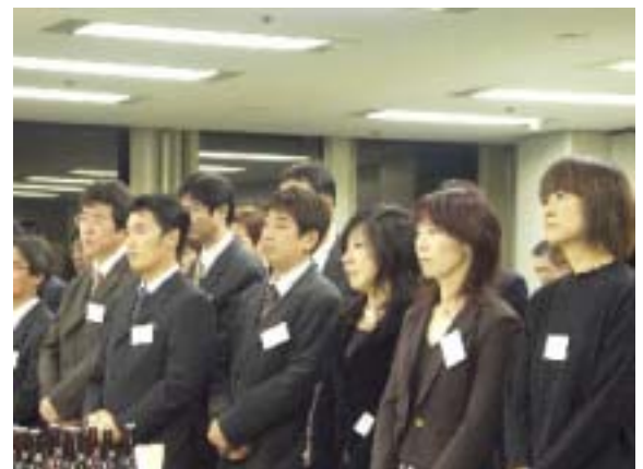
北州食品社員の面