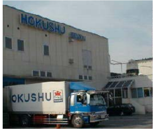
—北州食品仙台工場の外観—