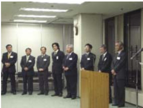
北州食品役員一同