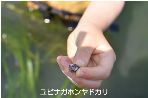
ユビナガホンヤドカリ