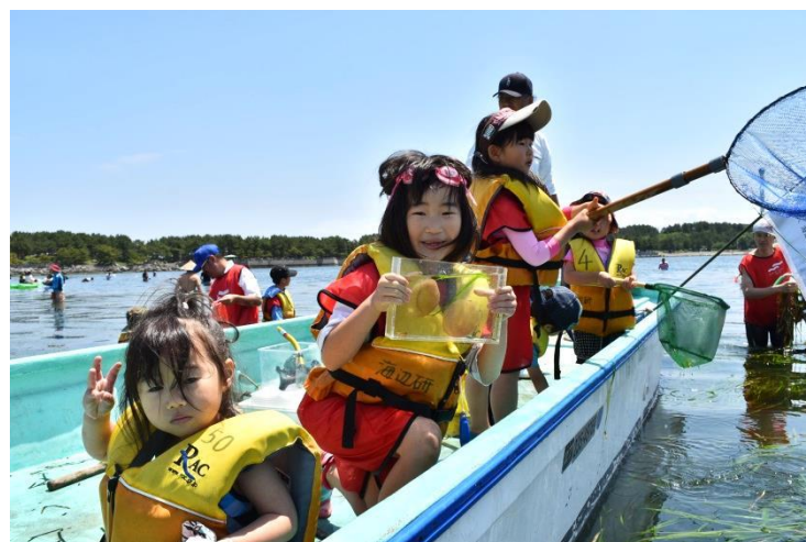
タマシキゴカイの卵も発見！ （中央：手に持っている水槽の中）