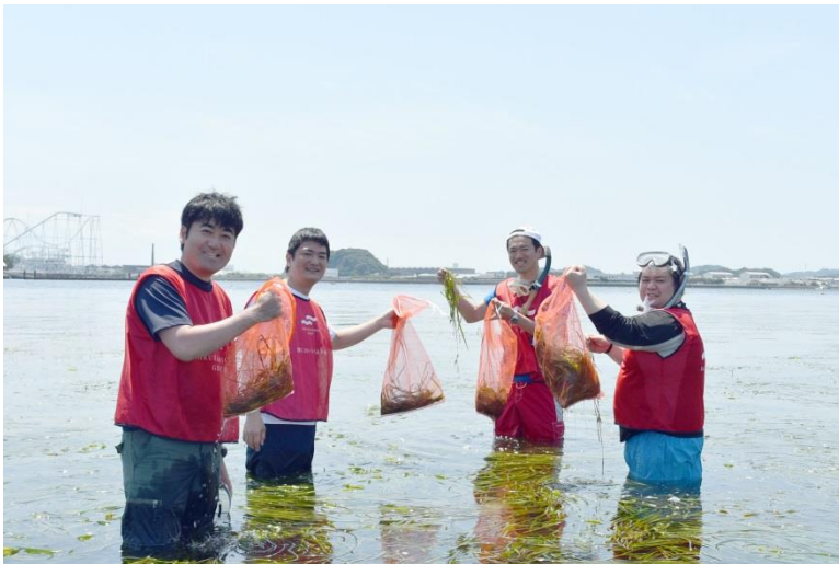
1,500 本の花枝を採取しました