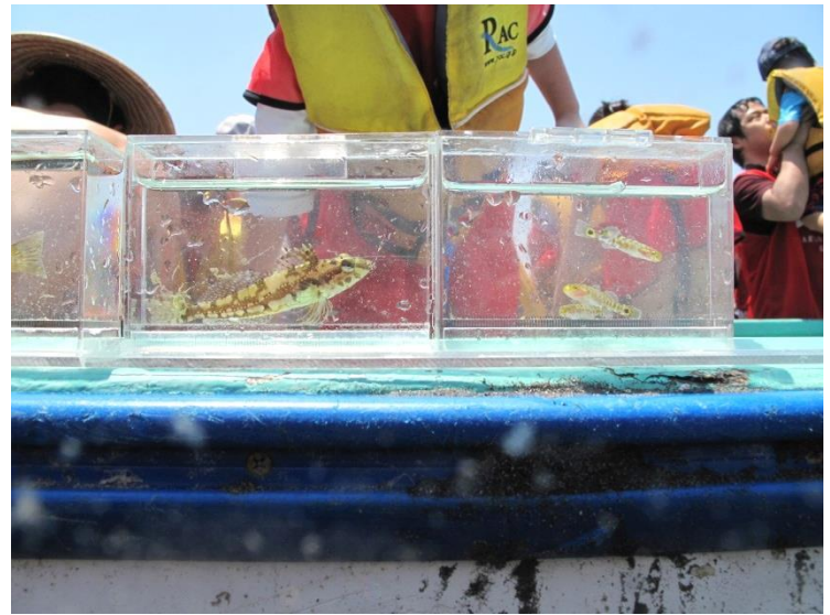
アサヒアナハゼ（左）やドロメ（右） 曳き網をして、魚の観察